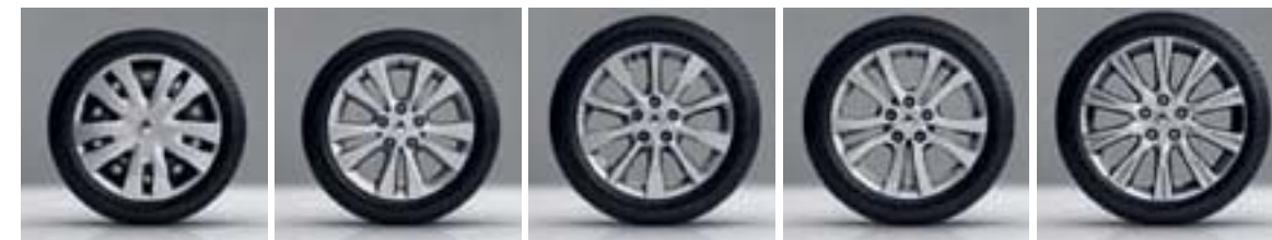
ENJOLIVEUR BLASON 16"